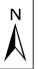
Abbildung: UTM 32N Projektion: Transverse Mercator Datum: ETRS 89 Höhendaten basierend auf Befliegungen ab 2016 Geobasisdaten © Landesamt für Geoinformation und Landentwicklung Baden-Württemberg, www.lgl-bw.de, Az.: 2851.9-1/19