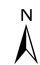
Abbildung: UTM 32N Projektion: Transverse Mercator Datum: ETRS 89 Höhendaten basierend auf Befliegungen ab 2016 Geobasisdaten © Landesamt für Geoinformation und Landentwicklung Baden-Württemberg, www.lgl-bw.de, Az.: 2851.9-1/19