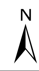
Abbildung: UTM 32N Projektion: Transverse Mercator Datum: ETRS 89 Höhendaten basierend auf Befliegungen ab 2016 Geobasisdaten © Landesamt für Geoinformation und Landentwicklung Baden-Württemberg, www.lgl-bw.de, Az.: 2851.9-1/19